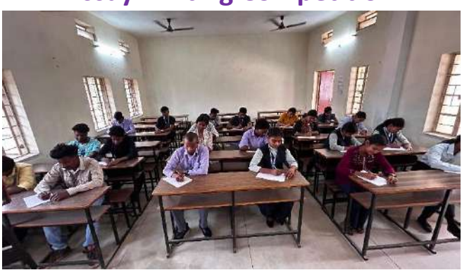
Chart Painting Competition