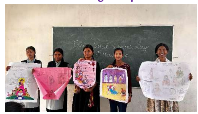
Slogan Writing Competition