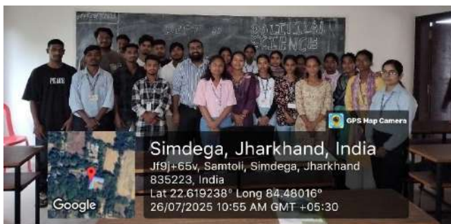
Department of Political Science