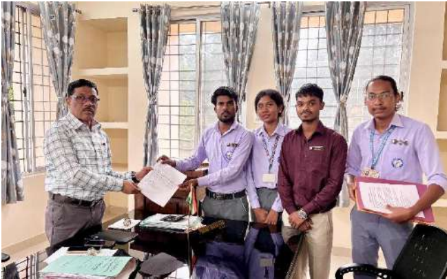
(Members meeting SDM, Simdega)

S tudents' council members met Sub-Divisional Magistrate (SDM) to submit the memorandum requesting the same.