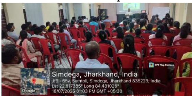
Workshop Valedictory Session