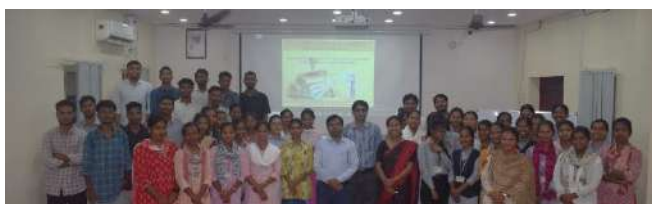
Postgraduate Students-II-Year in Workshop