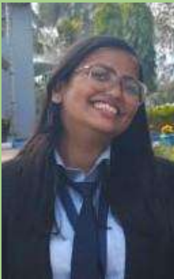
UGC-NET 2024 (Com.)