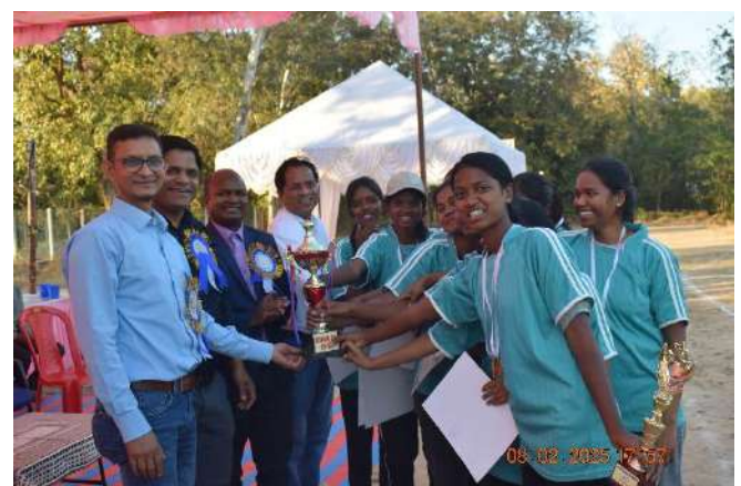
(Runner up: English Department)