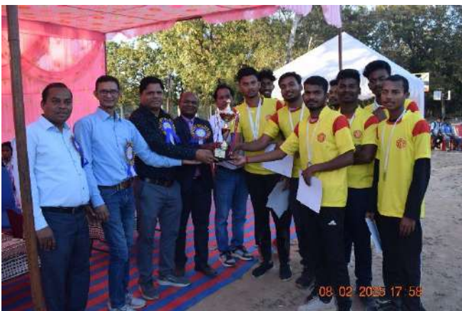
(Runner up: Ecommerce Department)