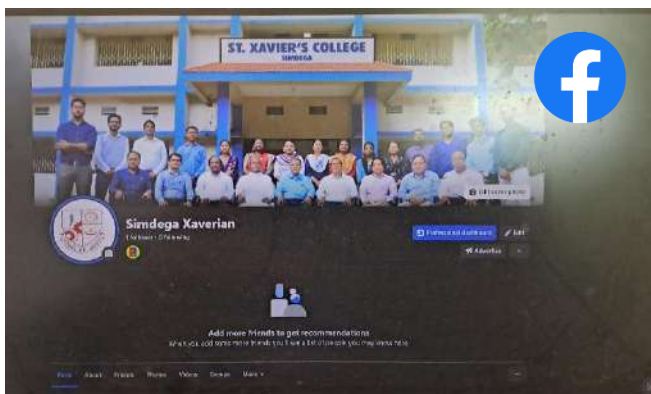
(Official Facebook Page)