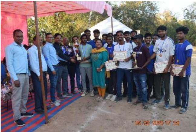
(Champion: English Department)