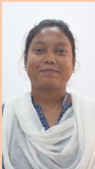
UGC NET-Ph. D 2024 (Hindi) Qualified CTET Exam Jan 2025