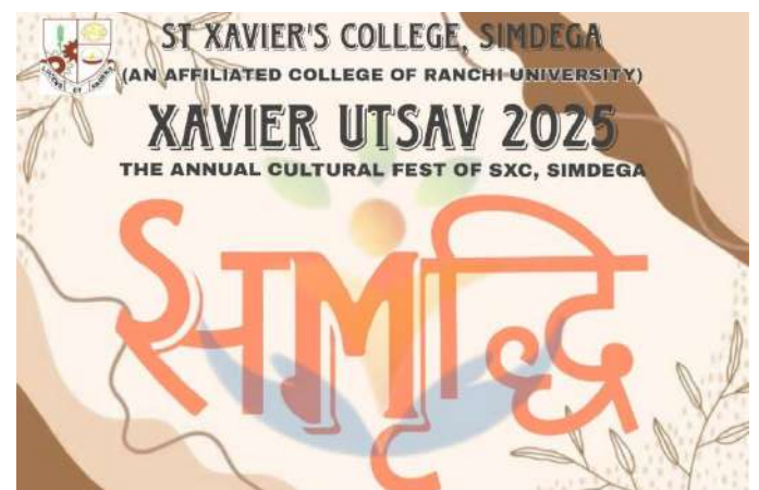
(LOGO: XAVIER UTSAV 2025)

The Environment and Energy Audits on 4 th of February 2025 were executed. The advisory audit team came from Ranchi for