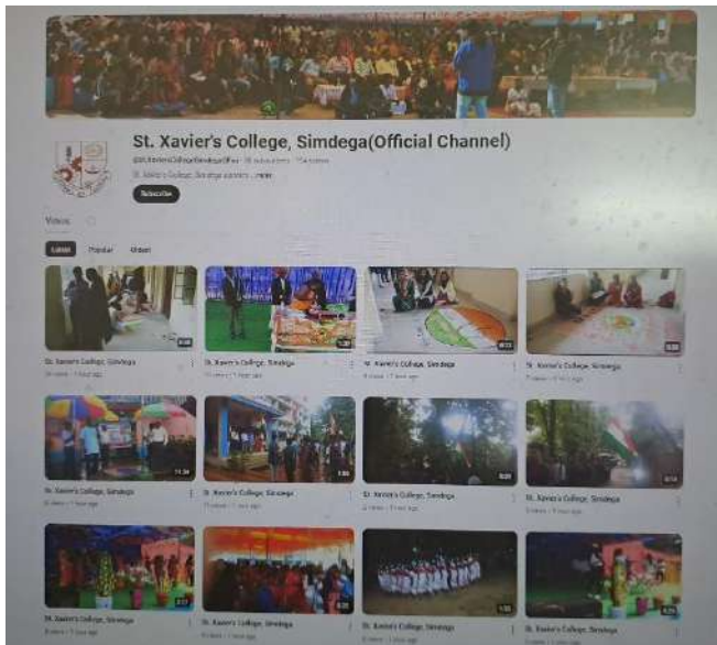
(Official YouTube Channel)