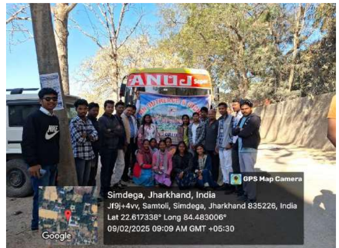
(Dept. of Economics)