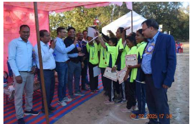
(Champion: Economics Department)