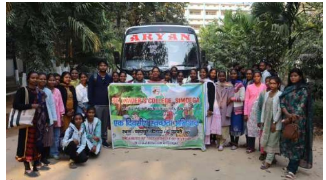
(Dept. of History)