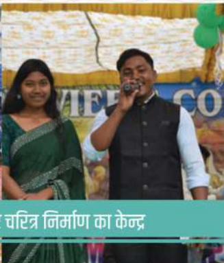
संत जेवियर्स कॉलेज, सिमडेगा: जीवन और चरित्र निर्माण का केन्द्र