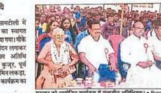
संत जेवियर कॉलेज में स्वागत समारोह का आयोजन किया गया।