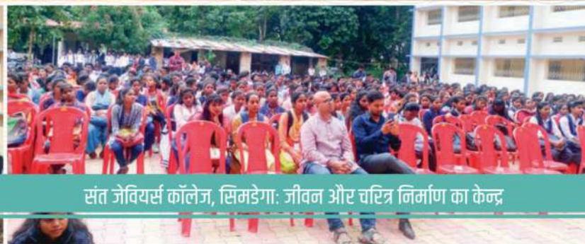
संत जेवियर्स कॉलेज, सिमडेगा: जीवन और चरित्र निर्माण का केन्द्र