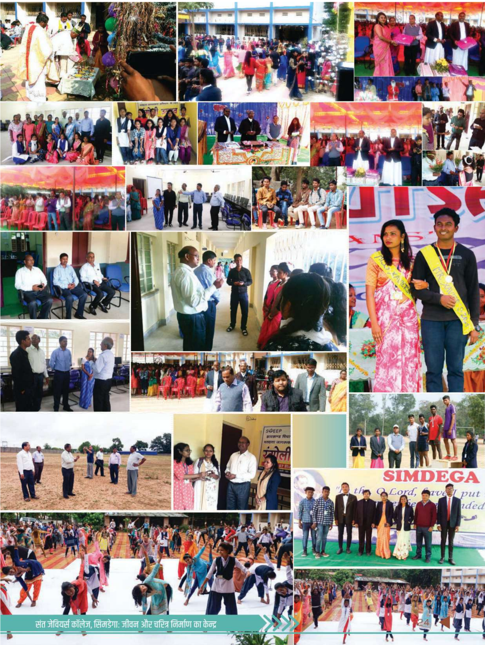
संत जेवियर्स कॉलेज, सिमडेगा: जीवन और चरित्र निर्माण का केन्द्र