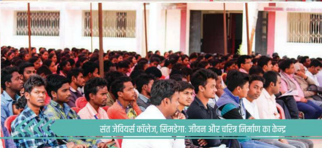
संत जेवियर्स कॉलेज, सिमडेगा: जीवन और चरित्र निर्माण का केन्द्र